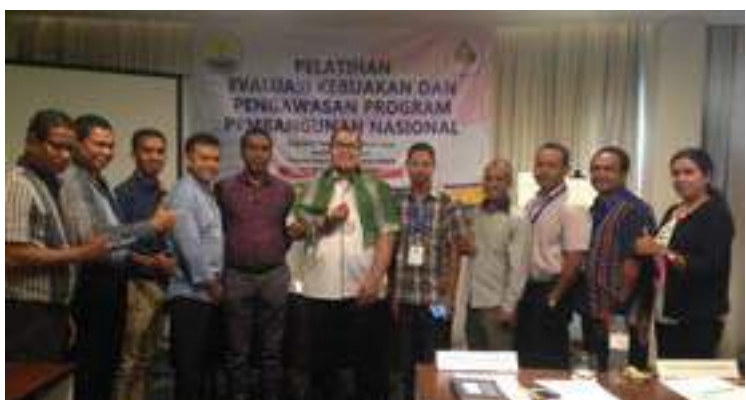
Funsionariu na'in 12 hosi intituaisun 4 hanesan FDCH, UPMA, INAP no Ministeriu Plano no Flnansas hasai foto hamutuk ho formador hafoin remata tiha formasaun iha Jakarta- Indonesia.