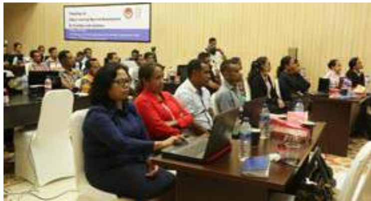
Partisipantes treinamentu SEA digital Class (Southeast Asian Digital Class) ne'ebé realiza hosi Embaixada Indonesia iha Timor-Leste liuhosi Pusat Budaya Indonesia ba dosente no mestre sira.