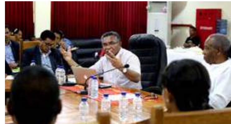
Ministru Saúde Dr. Rui Maria de Araújo hato'o nia breves palavras iha serimonia despedida ho bolseiru 29 ne'ebé atu ba hala'o estudu iha area mestrado no mediku especialista iha Cuba, 17/11/2017