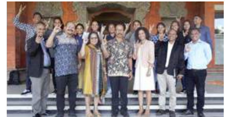
Ekipa Monitorizasaun hasai foto hamutuk ho dosente no estudante sira ne'ebé hala'o sira nia estudu iha area Medisina Veterinaria iha Universitas Udayana Bali.16/12/2017.