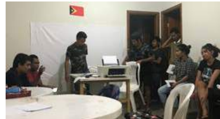
Renovasaun Passaporte Elektroniku ba estudantes bolseirus iha Uberlandia Brazil. 12/12/2017