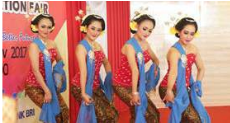
Grupus dansa kultura Indonesia hatudu sira nia dansa iha serimónia abertura ba Indonesia Education Fair ne'ebé realiza hosi Embaixada Indonesia iha TL, eventu ne'e hala'o iha PBI Mascarinhas, 16/11/2017.