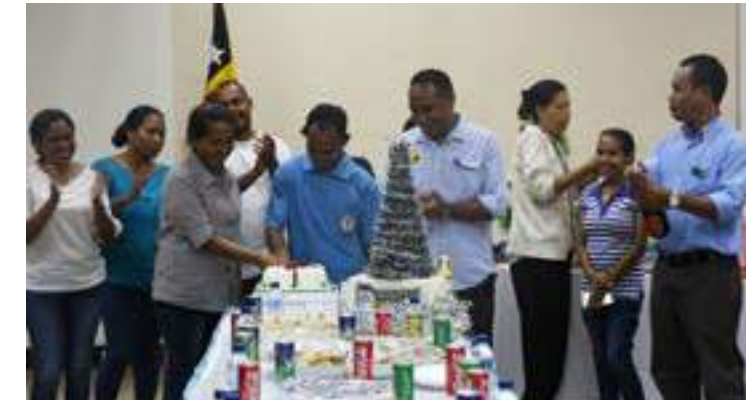
Selebrasaun Natal hamutuk sekretariu ezeutivu ho funsionario sira Secretariado tecnico FDCH. 22/12/2017