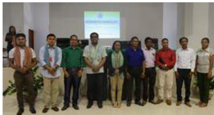
Sesaun foto hamutuk presidente interinu STQ akompana hosi ninia estrutura sira ho konvidadus importante sira ne'ebé mai hosi FDCH ME iha kongresu dahuluk ne'ebé realiza iha salaun Infordepe Balide, 21/12/2017