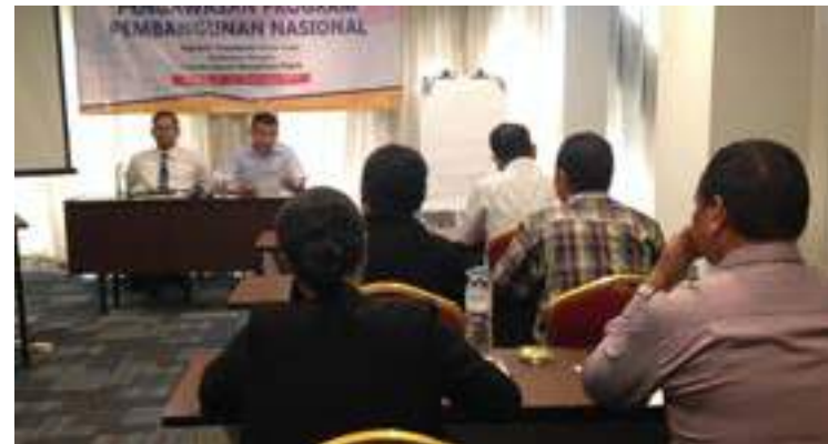
Funsionariu na'in 12 hosi intituaisun 4 hanesan FDCH, UPMA, INAP no Ministeriu Plano no Flnansas tuir formasaun iha Jakarta- Indonesia.