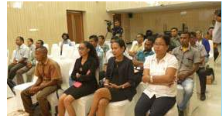
Partisipantes treinamentu SEA digital Class (Southeast Asian Digital Class) ne'ebé realiza hosi Embaixada Indonesia iha Timor-Leste liuhosi Pusat Budaya Indonesia ba dosente no mestre sira. 02/10/2017