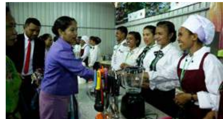
Espoza Presidente Republika Sra. Cidália Lopes Nobre Mouzinho Guterres halo vizita ba grupu ótelaria ne'ebé partisipa iha Konkursu Nasional ba Aptidaun, 15/11/2017.