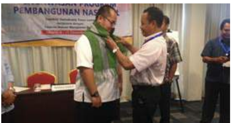
Partisipante iha formasaun tara hela tais ba formador nu'udar jestu apresiasaun hafoin remata tiha formasaun.