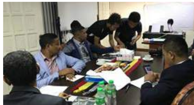
Renovasaun Passaporte Elektroniku ba estudantes bolseirus iha Filipina.05/12/2017