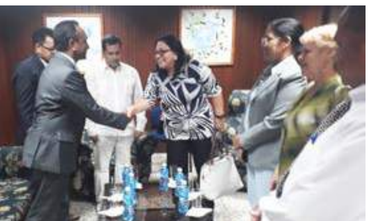
Embaixador RDTL ba Cuba, Sekretáriu Ezekutivu FDCH, Diretor Geral do MdS ho Adido da Educação RDTL iha Cuba ba hasoru ho Vice Ministra Governo Cubano nian iha ninian Gabinete ho Diretoras sira.