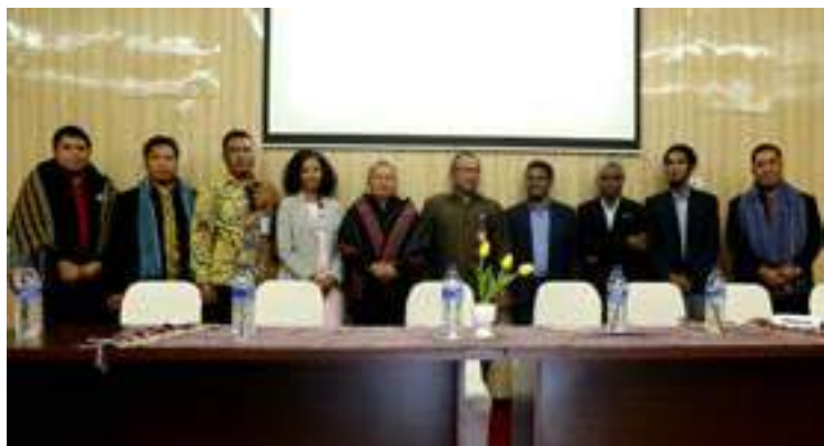
Secretariado tecnico do FDCH partisipa iha serimonia enseramentu ba treinamentu SEA digital Class (Southeast Asian Digital Class) ne'ebé realiza hosi Embaixada Indonesia iha Timor-Leste liuhosi Pusat Budaya Indonesia ba dosente no mestre sira.