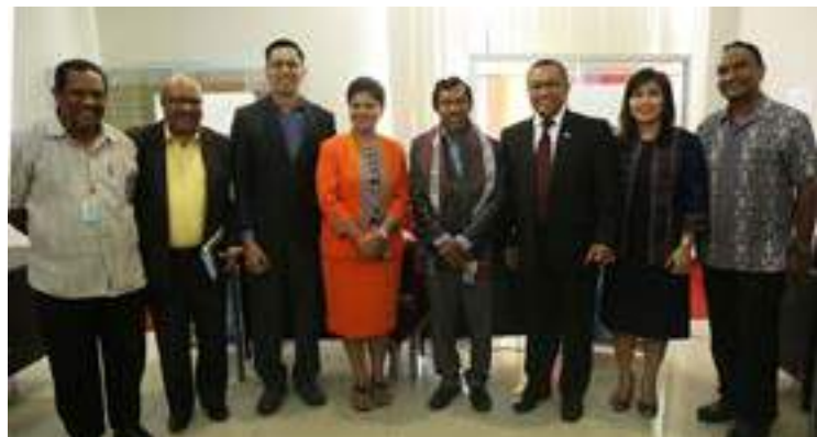
Sesaun foto hamutuk konvidadus VIP sira ho Embaisador Indonesia ba TL, Sahat Sitorus iha serimónia abertura ba Indonesia Education Fair ne'ebé realiza hosi Embaixada Indonesia iha TL, eventu ne'e hala'o iha PBI Mascarinhas, 16/11/2017.