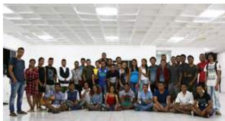
Renovasaun Passaporte Eletroniku ba estudantes bolseirus iha Paraiba, Brazil 09/12/2017