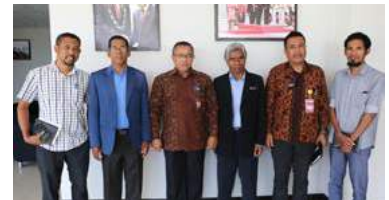
Secretariado Técnico- Fundo de Desenvolvimento do Capital Humano (FDCH) partisipa iha abertura ba treinamentu SEA digital Class realiza hosi Embaixada Indonesia iha Timor-Leste liuhosi Pusat Budaya Indonesia ba dosente no mestre sira. 02/10/2017