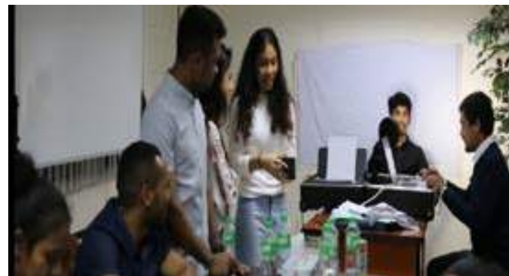
Estudantes Bolseirus iha Filipina halo renovasaun ba passaporte, atendumtu ne'e halao iha Embaixada RDTL iha Filipina.06/12/2017