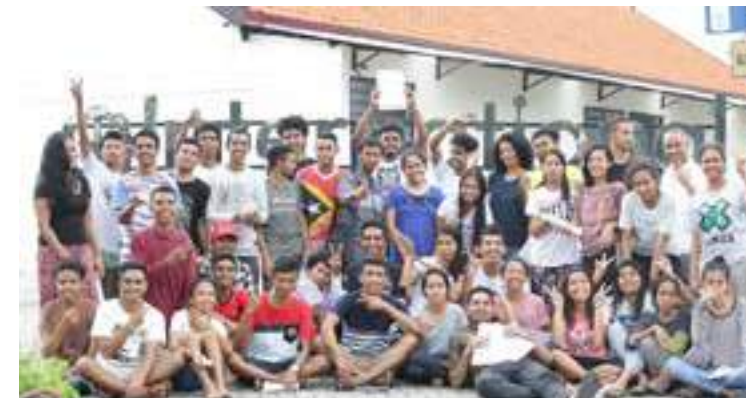
Sesaun foto hamutuk ekipa monitorizaun, representante empresa seguro da Vida Takaful ho estudante bolseiru FDCH 42 ne'ebé hala'o sira nia estudu iha ITS hafoin diskusaun kona-ba asisitensia ba sira nia saude. 10/12/2017.