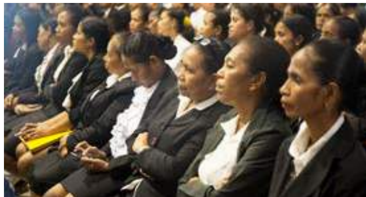
Partisipante feto sira ne'ebé partisipa iha Kursu Bacheralato ba Profesores Kontratadus realiza hosi UNTL no INFORDEPE liuhosi fundu FDCH, serimonia ne'e halao iha salaun INFORDEPE Balide Dili.19/12/2017