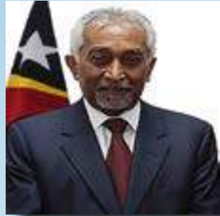
S.E. Dr. Mari Alkatiri

Primeiro Ministro e Ministro do Desenvolvimento e da Reforma Institucional - MDRI