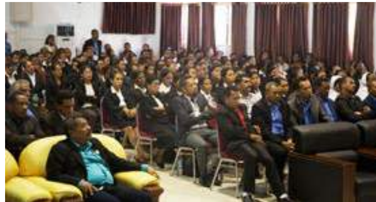
Abertura ba Kursu Bacheralato ba Profesores Kontratadus realiza hosi UNTL no INFORDEPE liuhosi fundu FDCH, serimonia ne'e hala'o iha salaun INFORDEPE Balide Dili.19/12/2017