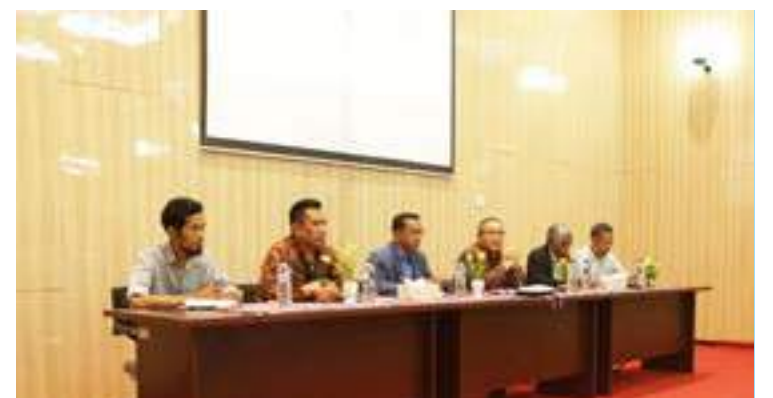
FDCH partisipa iha abertura ba treinamentu SEA digital Class (Southeast Asian Digital Class) ne'ebé realiza hosi Embaixada Indonesia iha Timor-Leste liuhosi Pusat Budaya Indonesia, treinamentu ne'e ba dosente no mestre sira. 02/10/2017