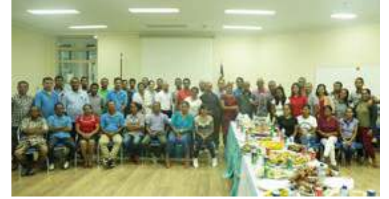
Sesaun foto hamutuk funsionariu sira Secretariado Tecnico FDCH ho Secretario Executivo iha selebrasaun Natal hamutuk, 22/12/2017