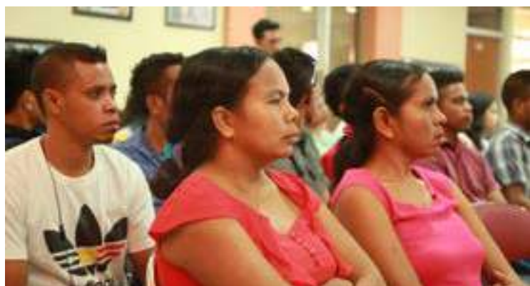
estajiáriu sira ho seriu rona hela hela esplikasaun iha seimonia asina kontratu ho governu molok sira hahú estájiu . 12/04/2017.