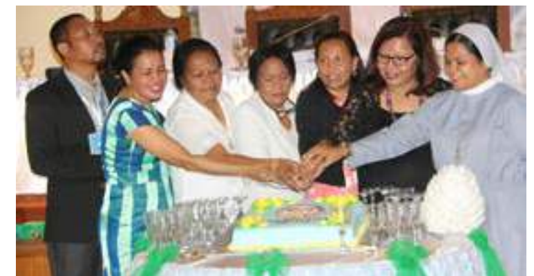
Ministra Finansas Sra. Santina Cardoso akompana husi konvidadus sira koa kek iha serimonia lansamntu livrus, realtoriu no okaziaun aniversariu FDCH nian ba dala VI, 18/05/2017.