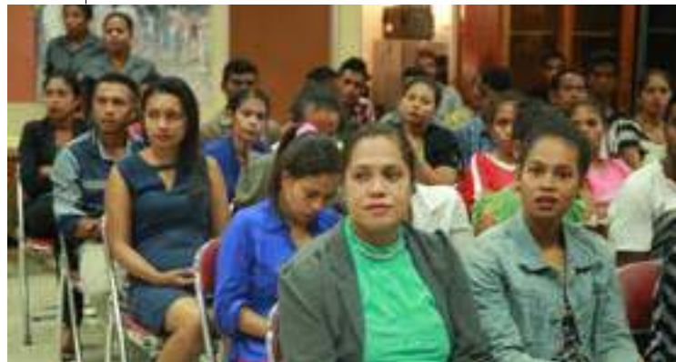
Estajiáriu sira ne'ebe selesionadu hodi halo estajiu durante fulan neen iha instituisaun estadu no setor privadu sira. 12/04/2017