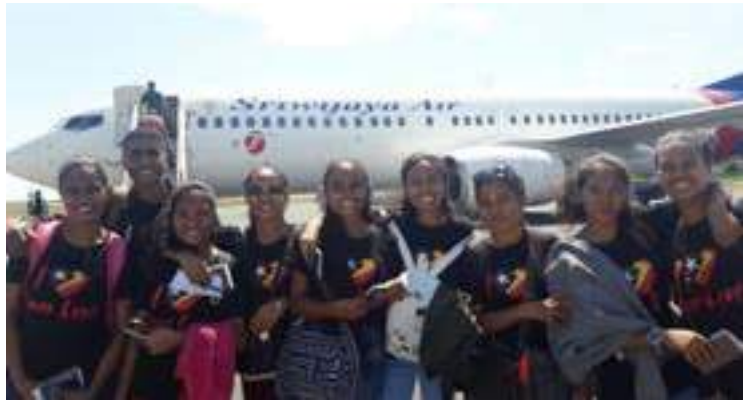
Bolseiru sira FDCH nian na'in 10 ne'ebe atu ba hala'o estudu iha Universidade UNUD Bali foto hamutuk molok aranka ba Indonezia. 29/04/2017