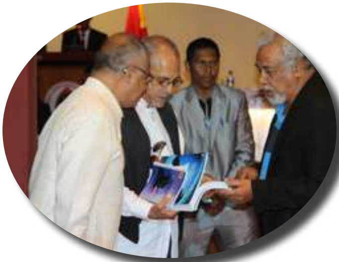
Lansamentus Livrus, Relatorius no Website FDCH; .....Pájina 6