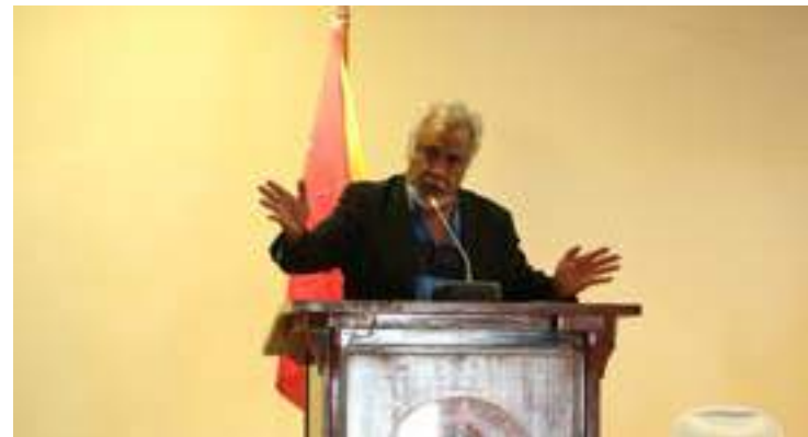
Presidente CA-FDCH Sr. Kay Rala Xanana Gusmão hato'o ninia ninia diskursu iha serimonia lanasamentu livrus no relatoriu FDCH iha CCD. Kinta 18/05/2017