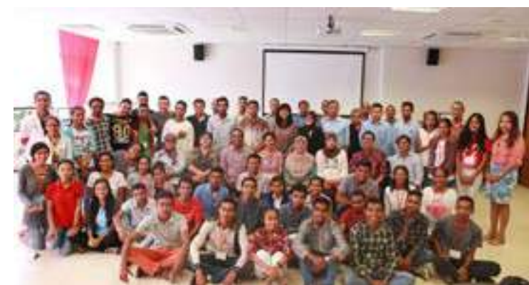
Sesaun foto hamutuk Sekretáriu Ezekutivu FDCH , ekipa juri ba ezame TPA no bolseiru selesiudau sira hafoin remata tiha ezame .20/04/2017.