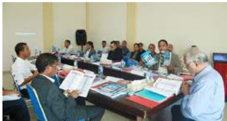
Enkontru Conselho Administração FDCH tinan 2017 ba dala uluk ne'ebe prezide dire- ita husi Prezidente CA-FDCH Sr. Kay Rala Xanana Gusmão, enkontru ne'e hala'o iha Salaun MPIE, Fatuhada Dili 24/04/2017.