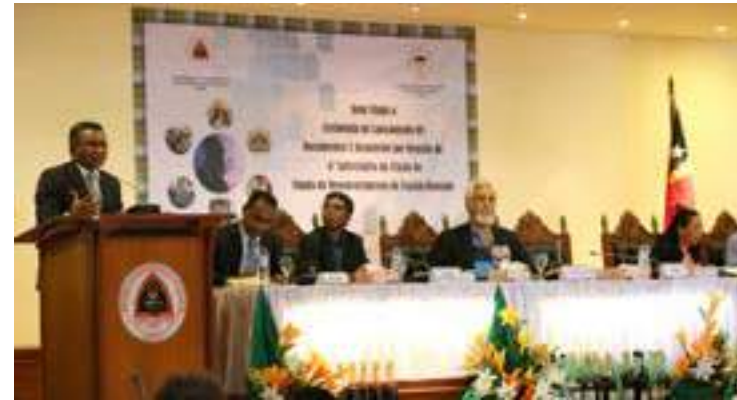
Primeiru Ministru Dr. Rui Maria de Araújo hato'o ninia diskursu iha serimonia lanasamentu ba livrus no relatoriu FDCH iha CCD. Kinta 18/05/2017.