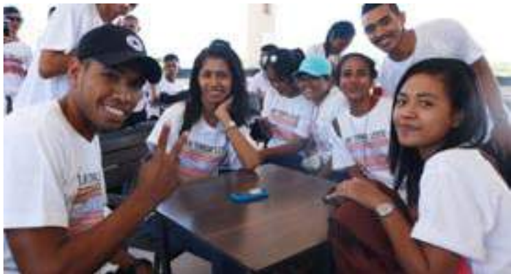
Bolseiru sira iha area enjeñaria nian ne'ebe atu ba hala'o estudu iha Universidade ITS Surabaya hasai foto hamutuk iha Aeroportu Nicolau Lobato molok aranka ba Indonezia, 05/05/2017