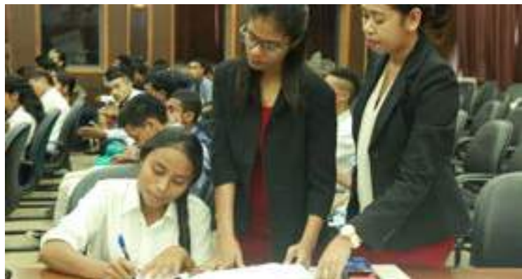
Bolseiru sira obrigatoriumente asina kontratu ho governu molok aranka ba hala'o sira nia estudu. 27/04/ 2017