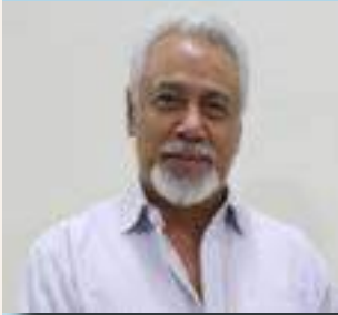
S.E. Sr. Kay Rala Xanana Gusmão

Ministru Planeamento e Investimento Estratégico