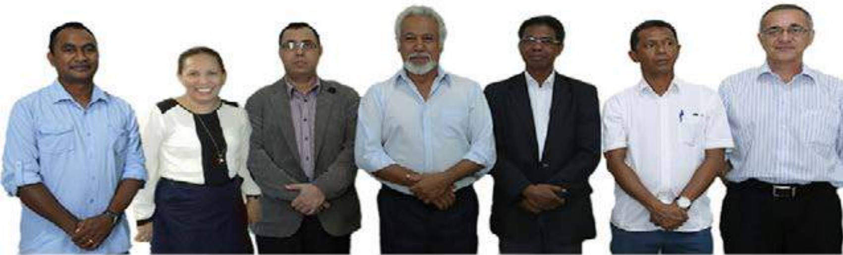
Foto Hamutuk Secretário Executivo ho Membro do Conselho de Administracao do FDCH