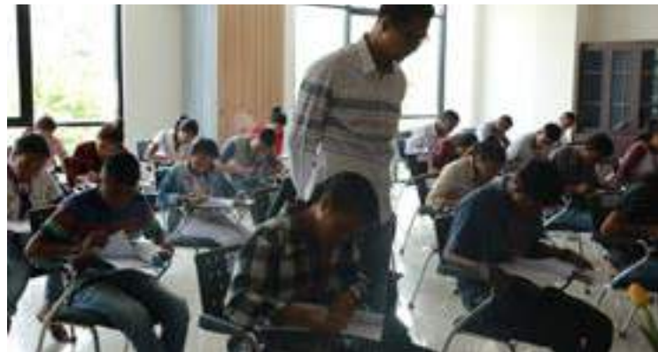
Konkorente sira ba vaga bolsa estudo FDCH nian tuir ezame TPA ne'ebe orgniaza direita husi universidade UDAYANA no ITS. ezame ne'e halao iha Edifisiu Pusat Budaya Indonesia Mascarenhas Dili, 18/04/2017