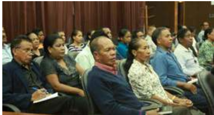
Inan aman Bolseiru sira nian partisipa iha serimonia depedida bolseiru FDCH na'in 52 ne'ebe mai husi Kombantes no Veteranus nian oan atu ba hala'o estudu iha universidade Udayana bali no ITS Surabaya. 27/04/2017.