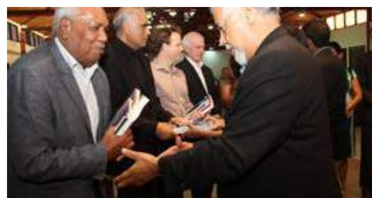
Prezidente CA-FDCH Sr. Kay Rala Xanana Gusmão entrega livru no relatoriu sira ba deputadu sira Parlamentu Nasional nian hafoin lansamentu, iha CCD, 18/05/2017