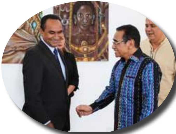
Prezidente Repúblika S.E. Dr. Francisco Guterres “Lu - Olo” husu FDCH Reforsa Nafatin Área Rekursus Umanus, Informasaun kompletu Le’e Iha..... Pájina 6.

Despedida; Ministru MPIE Husu Funsionarius Kontinua Servisu ho Kbit Hodi Servi Estadu ho Laran Tomak.... ...Pájina 7.