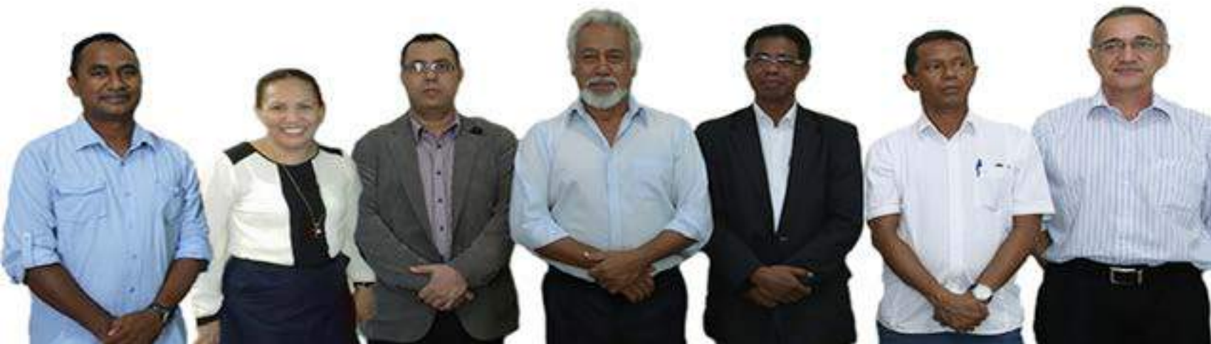
Foto Hamutuk Sekretário Executivo ho Membro do Conselho de Administração do FDCH