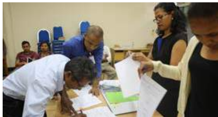
Inan aman bolseiru FDCH asina kontratu ho Secretariado Tecnico FDCH.