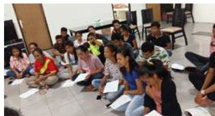
Bolseiru sira rona hela esplikasaun bainhira hetan monitoriza hosi ekipa FDCH.