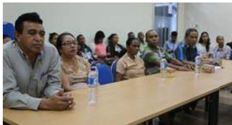
Inan aman bolseiru veteranus no kombatentes nian oan rona esplikasuan kona-ba kontratu ne'ebe FDCH estabese ho bolseiru sira ne'ebe hala'o estudu iha UNUD Bali no ITS Surabaya.