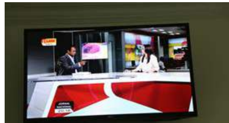
Aprezentadora Noticias GMN TV halo entrevista eksklusivu ho Sek-retariu Ezekutivu FDCH, ligadu ho progresu dezenvolvimentu rekur-su umanus nasional.