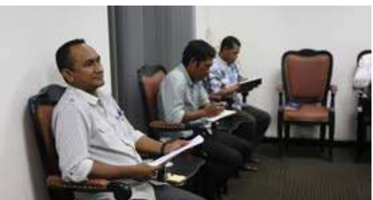
Reuniaun ho Gabinete Primeiru Ministru VI governu Konstitusional nian hodi buka posibilade atu apoiu formasaun ba funsionariu Gabinete PM.