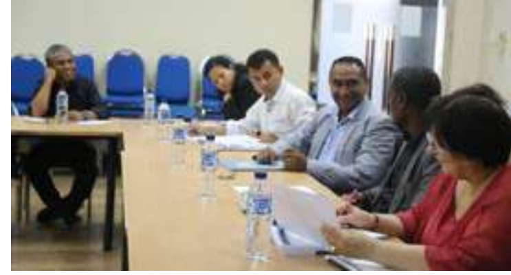
Ekipa FDCH ho ekipa delgasaun hosi PALOP-TL halo diskusaun koanaba area rekursu umanus, diskusaun ne'e halao iha salaun Knowledge Center eis edifisiu Ministeriu Finanzas.