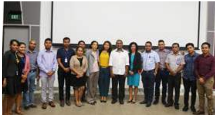
Sekretariu Ezekutivu FDCH ho nia Ekipa hasai foto hamutuk ho Bolseirus Graduadus hosi Ministeriu Finansas nebe halo aprezen-ta-saun hikas ba MoF tuir materia nebe bolseirus graduadus ida-idak nia area, nudar programa reseisaun hodi reitegra fali bolseiru sira ba MoF.