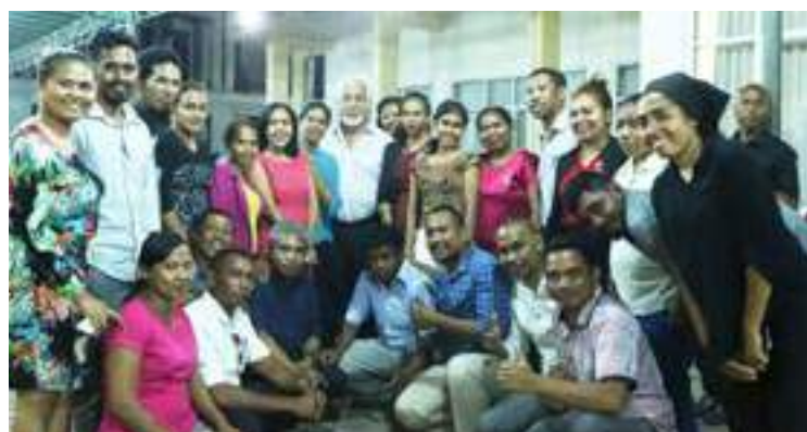
Staff FDCH foto hamutuk ho Ministru MPIE & Prezidente CA-FDCH S.E. Sr. Kay Rala Xanana Gusmao iha Misteriu MPIE Fatuhada Dili