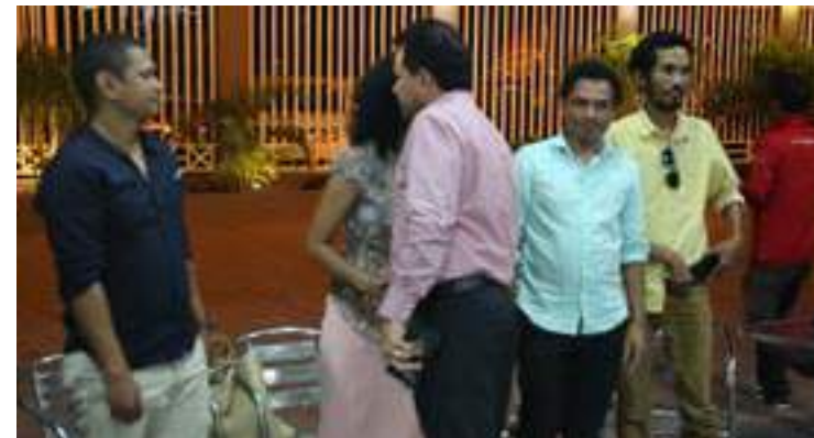
Prezidente Konsellu Administrasaun GMN TV simu Ekipa FDCH iha Studio GMN TV iha Bebora Dili, Timor-Leste