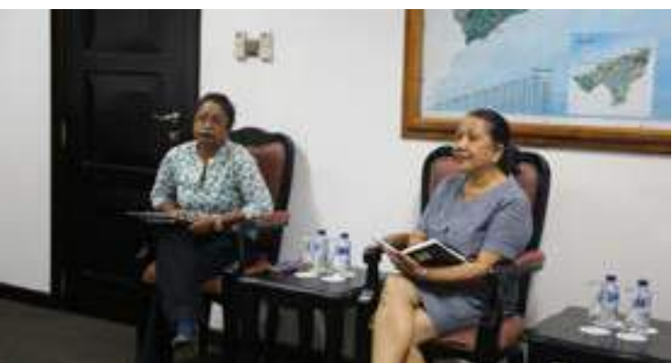
Reuniaun ho Gabinete Primeiru Ministru VI governu Konstitusional nian hodi buka posibilade atu apoiu formasaun ba funsionariu Gabinete PM.