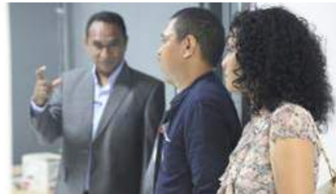
Ekipa FDCH halo Vizita ba sala redasaun GMN TV molok tuir entrevista eksklusivu konaba apoiu FDCH ba forma-saun timoroan sira.