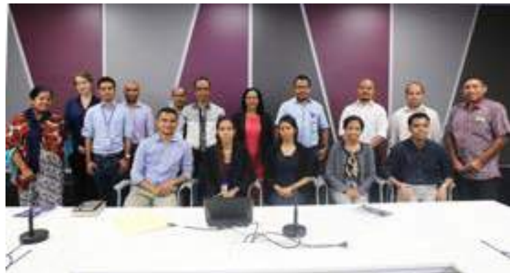
Sesaun foto hamutuk bolseiru graduadu sira hosi dirijente sira hosi FDCH no Ministeriu Finansas hafoin remata aprezentasaun.