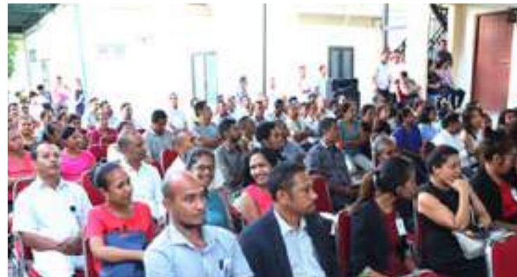
Funionarius MPIE partisipa serimonia despedida ho Ministru MPIE & Prezidente Konsellu Administrasaun FDCH S.E. Sr. Kay Rala Xanana Gusmao iha edifisiu MPIE Fatuhada iha loron 5/10/2017