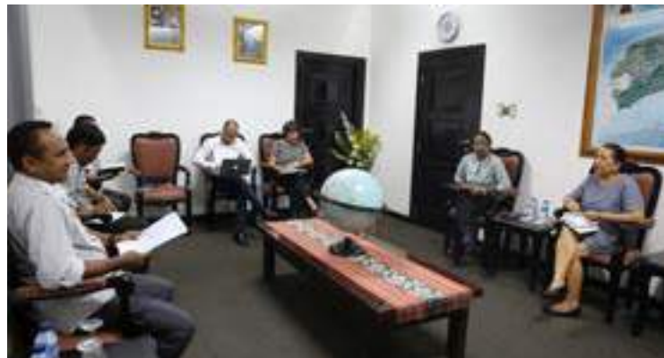
Reuniaun ho Gabinete Primeiru Ministru VI governu Konstitusional nian hodi buka posibilade atu apoiu formasaun ba funsionariu Gabinete PM.