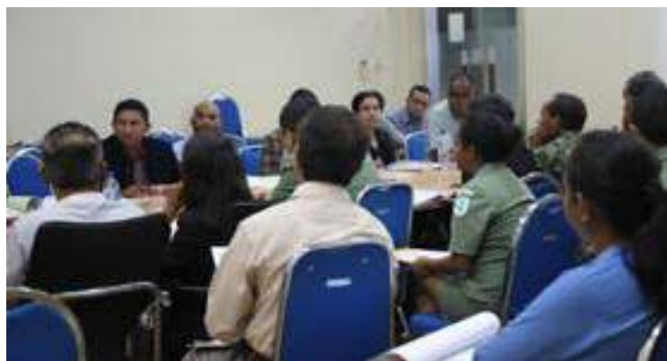
Reuniaun Sekretariadu FDCH ho Linhas Ministeriais 12 nebe oraganiza bolsa estudo, reuniaun ne'e atu buka tuir paradeiru bolseirus graduadus hosi tinan 2011 - presente.