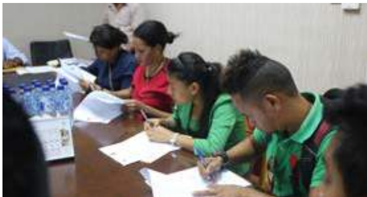
Kompanhia lokal sira ansina kontratu hodi servisu hamutuk ba apoiu servisu FDCH durante tinan ida.