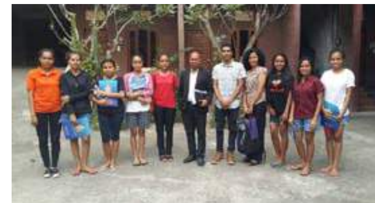
Sesaun foto hamutuk hafain monitoriza no vizita bolseiru sira iha sira ninia hela fatin.