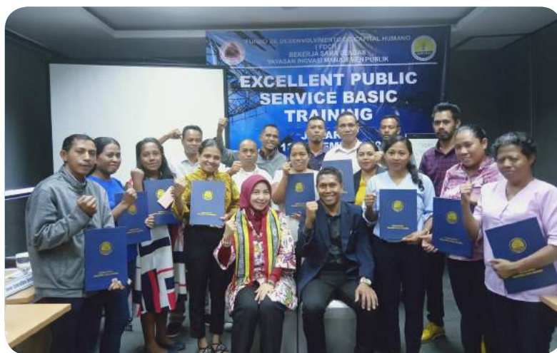
Foto hamutuk Funsionariu sira husi ST-FDCH ho formador sira hafoin termina formasaun iha Jakarta.