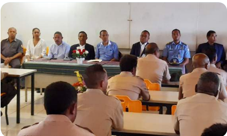
FDCH finansia formasaun ba tékniku Guarda Floresta na'in 43 husi munisipiu hotu no RAEOA.