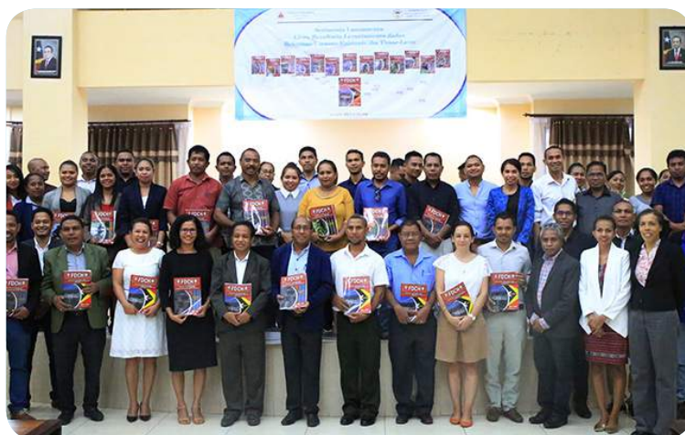
Sesaun foto hamutuk ho konvidadus sira ne'ebe partisipa iha serimonia lansamentu livrus LDRHE.