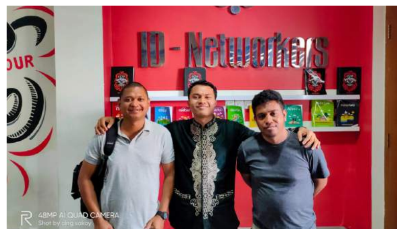
Fursionariu DESTI-GAGESI -FDCH tuir formasaun iha area tolu hanesan Jestaun ba Windows Server, Microtik no Web programing (Laravel Frame work) iha Jakarta.