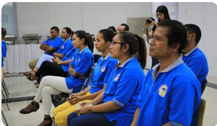
Funisionarius ST-FDCH tuir formasaun PMP ne'ebé hetan kooperasaun ho forneseador ba formasaun nian mak kompañia Telekom Internasional (TELIN) Indonesia liu husi Telkomcel iha Timor-Leste