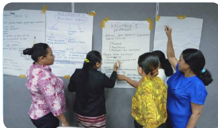
Funsionariu sira husi ST-FDCH partisipa formasaun konna-ba atendumtu publiku nian iha Jakarta.