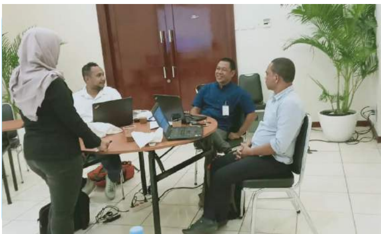
Fursionariu DEMEREP-GAGESI- FDCH na'in 3 tuir formasaun Multimedia iha Media Akademi (Metro TV).