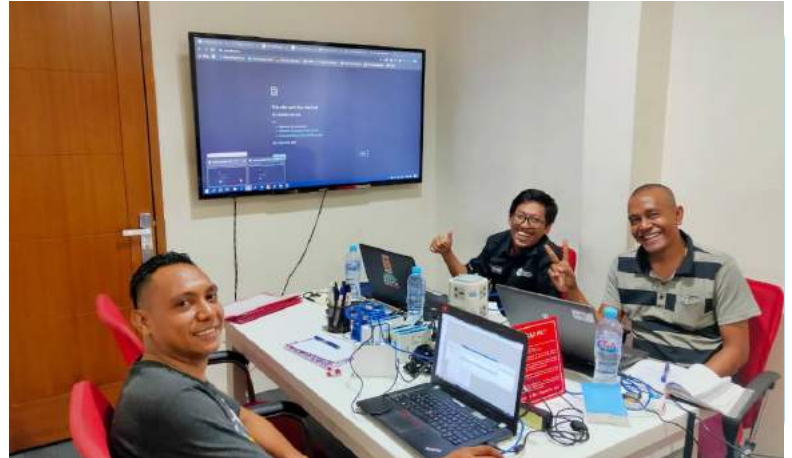
Fursionariu DESTI-GAGESI -FDCH tuir formasaun iha area tolu hanesan Jestaun ba Windows Server, Microtik no Web programing (Laravel Frame work) iha Jakarta.