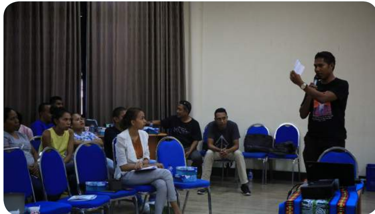
Atividade ST-FDCH hodi haree ba progresu servisu no dezafiu sira neêbe enfrenta iha 2019.