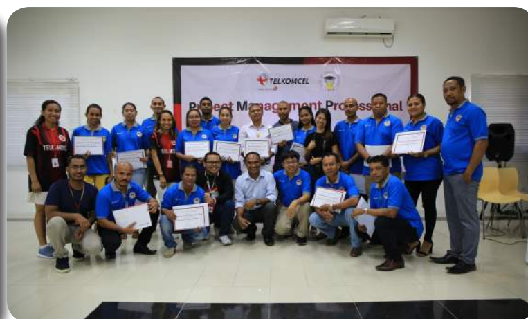
Sesaun foto hamutuk Funisionarius ST-FDCH ho formador sira no Sekretariu Ezekutivu FDCH hafain simu sertifikadu.