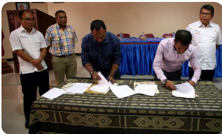
SEFOPE ho FDCH asina Memorandum Entendimentu ho STP Bali, Indonesia no Novo Turismo, iha salaun enkontru SEFOPE, Cai-Coli, 18/10/2019