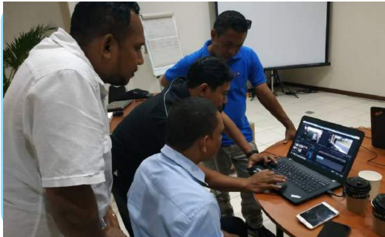
Fursionariu DEMEREP-GAGESI- FDCH na'in 3 tuir formasaun Multimedia iha Media Akademi (Metro TV).