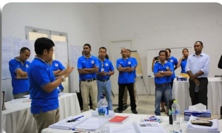
Funisionarius ST-FDCH tuir formasaun PMP ne'ebé hetan kooperasaun ho forneseador ba formasaun nian mak kompañia Telekom Internasional (TELIN) Indonesia liu husi Telkomcel iha Timor-Leste