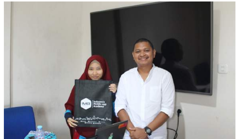
Fursionariu DESTI-GAGESI -FDCH tuir formasaun iha area tolu hanesan Jestaun ba Windows Server, Microtik no Web programing (Laravel Frame work) iha Jakarta.