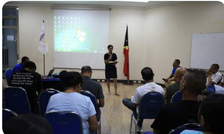
Atividade avaliasaun servisu ST-FDCH hodi haree ba progresu servisu no dezafiu sira neêbê enfrenta iha 2019.