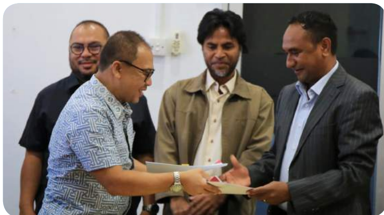
Sekretariu Ezekutivu FDCH troka nota ho direktor rekursus umanus Metro TV hafoin asina tiha MoU . 18/10/2019