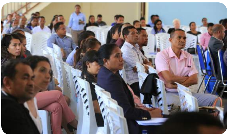
Funsinarius no dirijenti sira ho seriu rona hela esplikasaun iha enkontru jerál Ministério Ensino Superior e Cultura nêbé realiza iha Salaun Katedral.