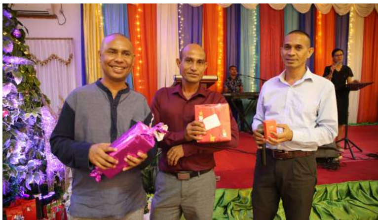
Funsionariu sira ST-FDCH troka prezente bainhira festeza Natal no Tinan foun, atividade neê hala'õ iha salaun Delta Nova, 21/12/2019