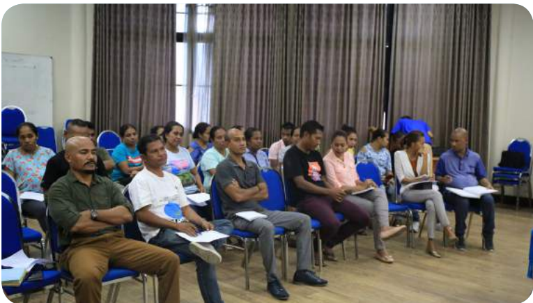
Atividade avaliasaun servisu ST-FDCH hodi haree ba progresu servisu no dezafiu sira neêbe enfrenta iha 2019.