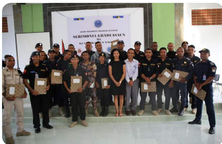
Sesaun foto hamutuk diretores sira ho formandus hafoin simu sertifikadu. 18/12/2019