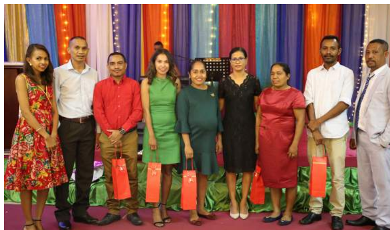
Foto hamutuk Diretora Ezekutiva FDCH, koordinador sira ho funsinariu sira neêbe hetan rekonesimentu nu'udar the best staff of the year 2019 .