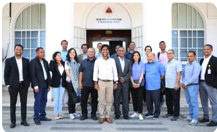
Sesaun foto hamutuk hafoin estabelese MoU SEKOMS -FDCH ho Media Indonesia (Metro TV) , 18/10/2019 .