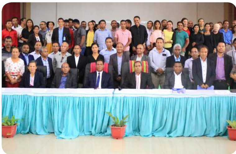
Sesaun foto hamutuk Ministru MESCC ho dirijenti no funsinariu sira hafoin termina enkontru Jeral iha Salaun Katedral .