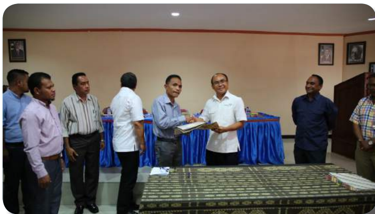
SEFOPE ho FDCH asina Memorandum Entendimentu ho STP Bali, Indonesia no Novo Turismo, iha salaun enkontru SEFOPE, Cai-Coli, 18/10/2019.