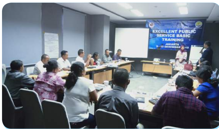
Funsionariu sira husi ST-FDCH partisipa formasaun konna-ba atendumtu publiku nian iha Jakarta.