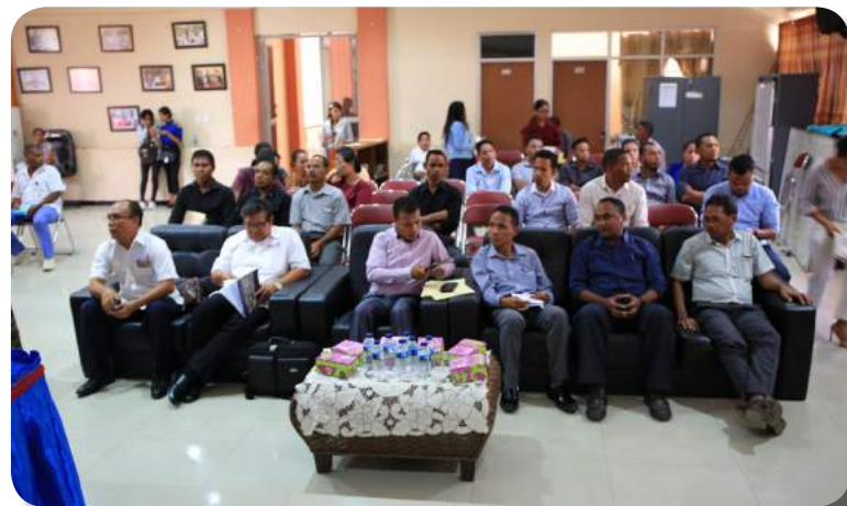
SEFOPE ho FDCH asina Memorandum Entendimentu ho STP Bali, Indonesia no Novo Turismo, iha salaun enkontru SEFOPE, Cai-Coli, 18/10/2019.