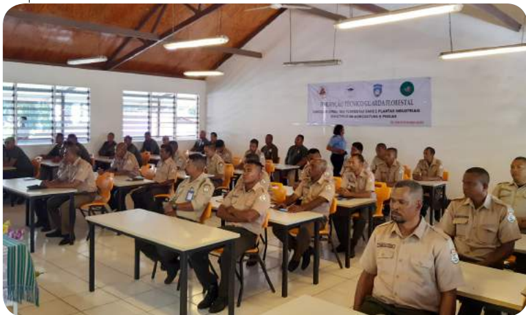
FDCH finansia formasaun ba tékniku Guarda Floresta na'in 43 husi munisipiu hotu no RAEOA.