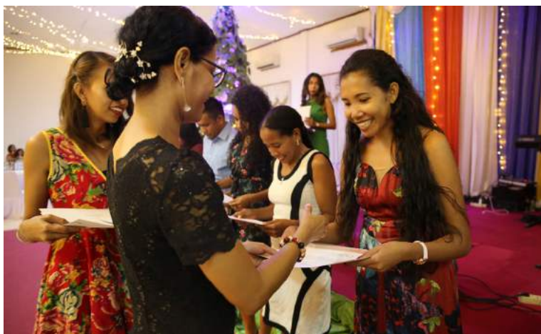
Diretora Ezekutiva FDCH entrega sertifikadu ba bolsieru graduadu ida neêbe partisipa iha progama Etajiu Profisional, 21/12/2019.