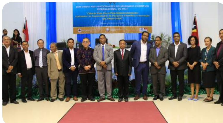
Sesaun foto hamutuk ho bainaka importante sira hafoin abertura ba semináriu sientífiku ho tema “ Ciência pela paz e pelo Desenvolvimento ; Fortalecer as capacidades de pesquisa científica e inovação em Timor-Leste ” ne'ebé organiza husi INCT