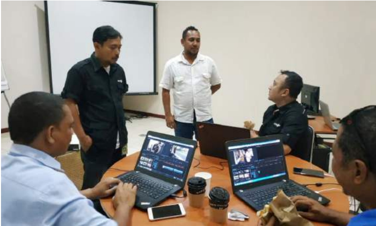
Fursionariu DEMEREP-GAGESI- FDCH na'in 3 tuir formasaun Multimedia iha Media Akademi (Metro TV).