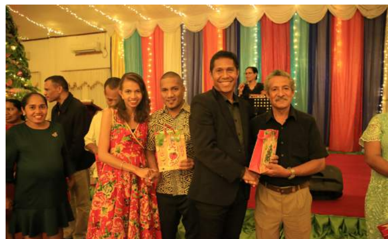
Funsionariu sira FDCH entrega prezente nu'udar apresiasaun ba instituisaun sira neêbe koopera di'ak tebes ho FDCH.