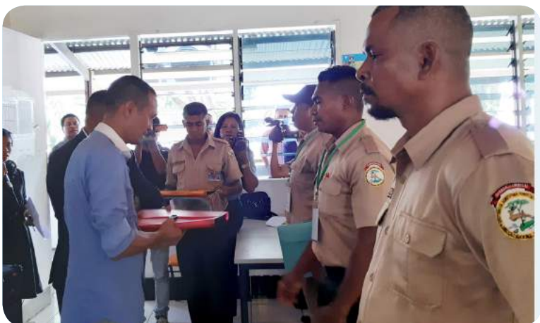
Koordenador GAPPEFIV reprezenta Diretora Ezekutiva FDCH entrega ekipamentu formasaun ba formandu sira ne'be partisipa iha formasaun.