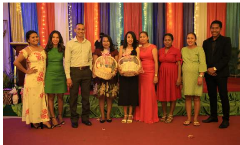
Koordinador GAPPEFIV ho ekipa entreza prezente ba estajiar-iu na'in 2 neêbe durante neê hala'õ ona estajiu iha gabinete neê nu'udar jestu apresiasaun ba sira nia servisu.