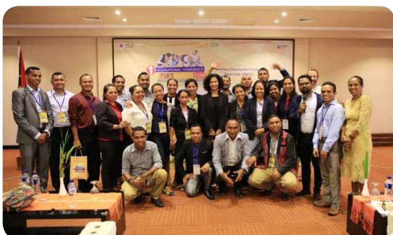
Sesaun foto hamutuk hafoin remata Konferensia Internasional ne'be organiza husi INDMO iha Hotel Novo Turismo