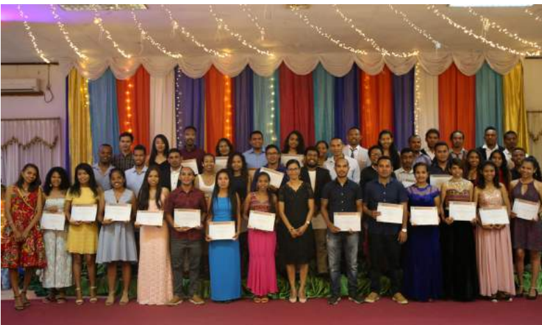
Sesaun foto hamutuk bolseirus gradus sira neêbe hola parte ona iha programa Estajiu profisional, ho Diretora Ezekutiva FDCH no koordinadores hafoin simu sertifikadu. 21/12/2019.