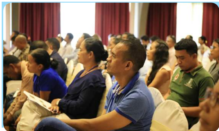
Koordenador GAPPEFIV-FDCH partisipa iha Konferensia Internasional ne'be organiza husi INDMO iha Hotel Novo Turismo.